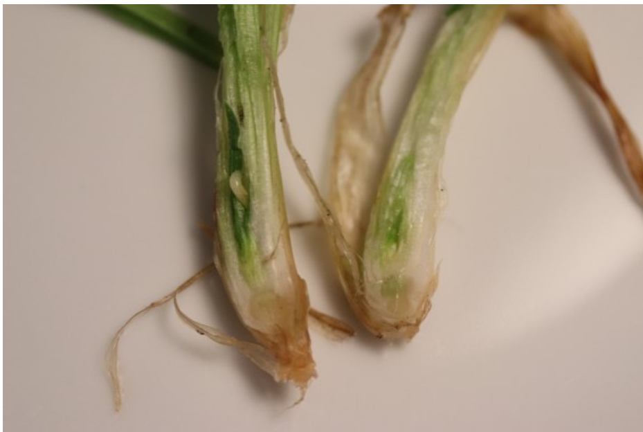
Billede 4. Når de fortykkede skud flækkes, ses bygfluens larve (tv.).