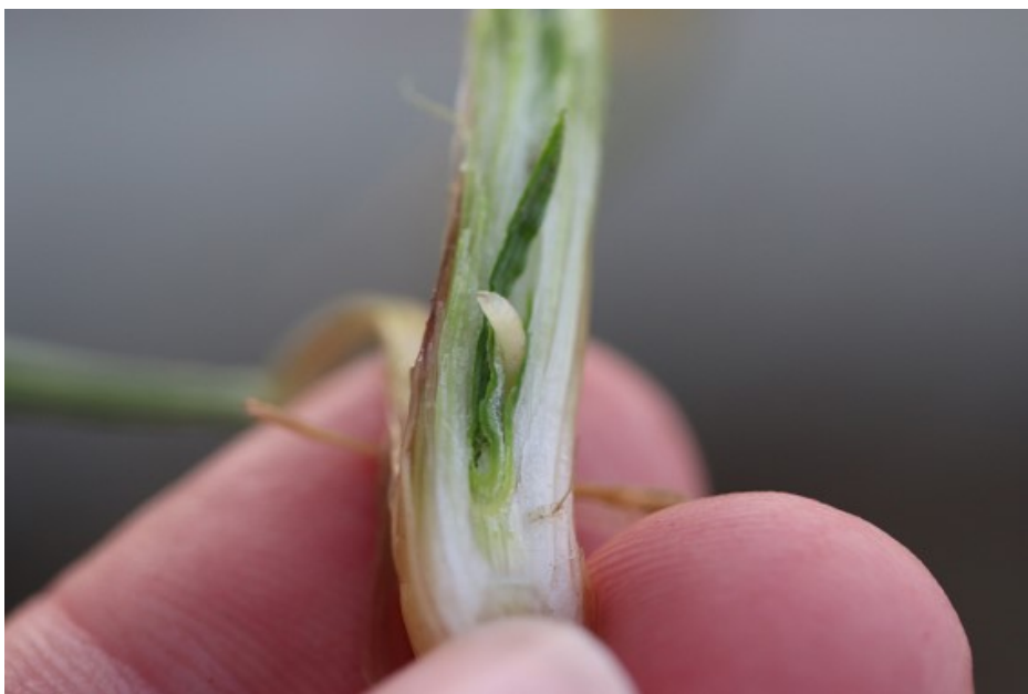
Billede 5. Bygfluelarve inde i fortykket skud. Larven er ca. 5 mm i udviklet tilstand.

Kontakt din lokale rådgivningsvirksomhed , hvis du vil vide mere om dette emne.