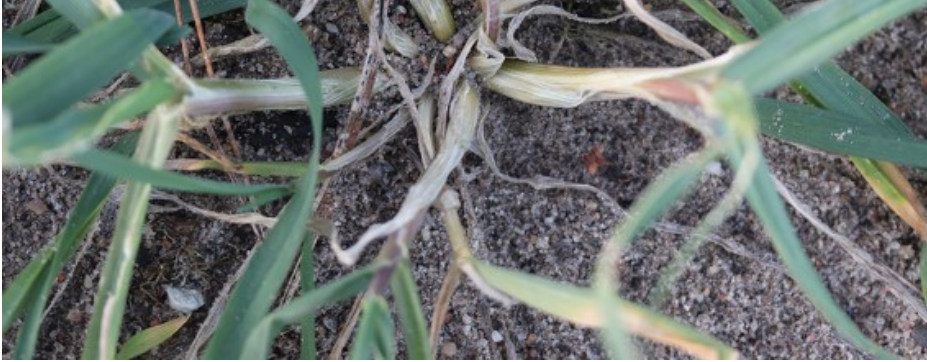
Billede 1. Rugplante, hvor 5 af skuddene er fortykkede og angrebet af bygfluens larve. Planten er mere "udspilet", og det ser ud som om, at man har trådt på den.