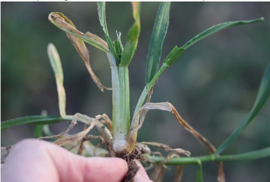
Billede 2. Nærbillede af fortykket skud. Skuddet ligner et forårsløg.